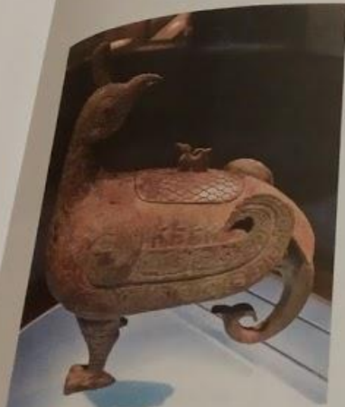
Vaso a forma di drago.