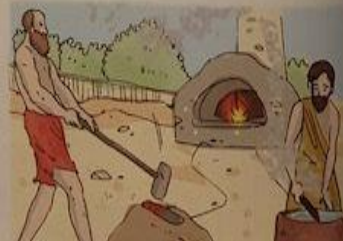
SOTTOSUOLO RICCO DI MINERALI