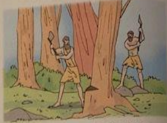
FORESTE DA CUI RICAVARE LEGNAME