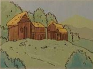
SULLE ALTURE ZONE SALUBRI E FACILMENTE DIFENDIBILI