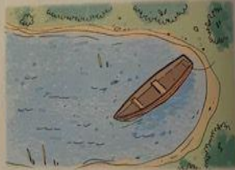
LE COSTE FRASTAGLIATE ABBONDANO DI PORTI NATURALI