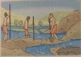
ZONA RICCA DI ACQUA

1 Per ciascun disegno, scrivi una breve didascalia che spieghi le condizioni che favorirono l'insediamento degli Etruschi in Etruria. LE INFORMAZIONI SONO A PAGINA 60