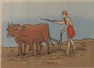
TERRENO FERTILE CHE CONSENTIVA LA PRATICA DELL'AGRICOLTURA